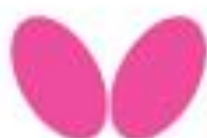
TABLE TENNIS FOR YOU 卓球をあなたへ