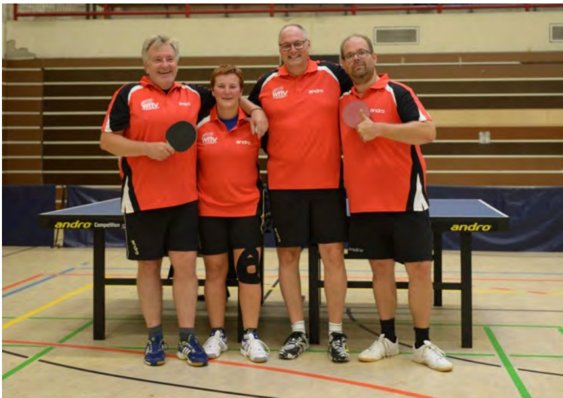
Westdeutscher TTV 1