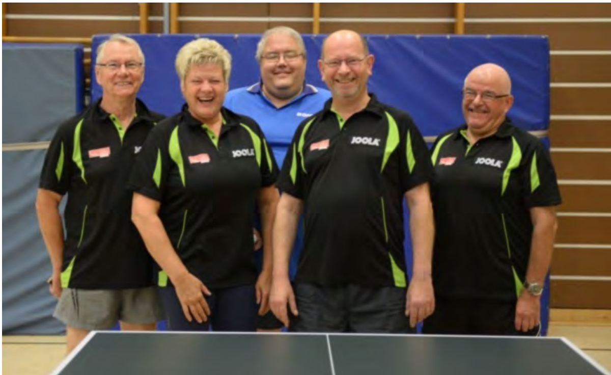
Berliner TTV 2