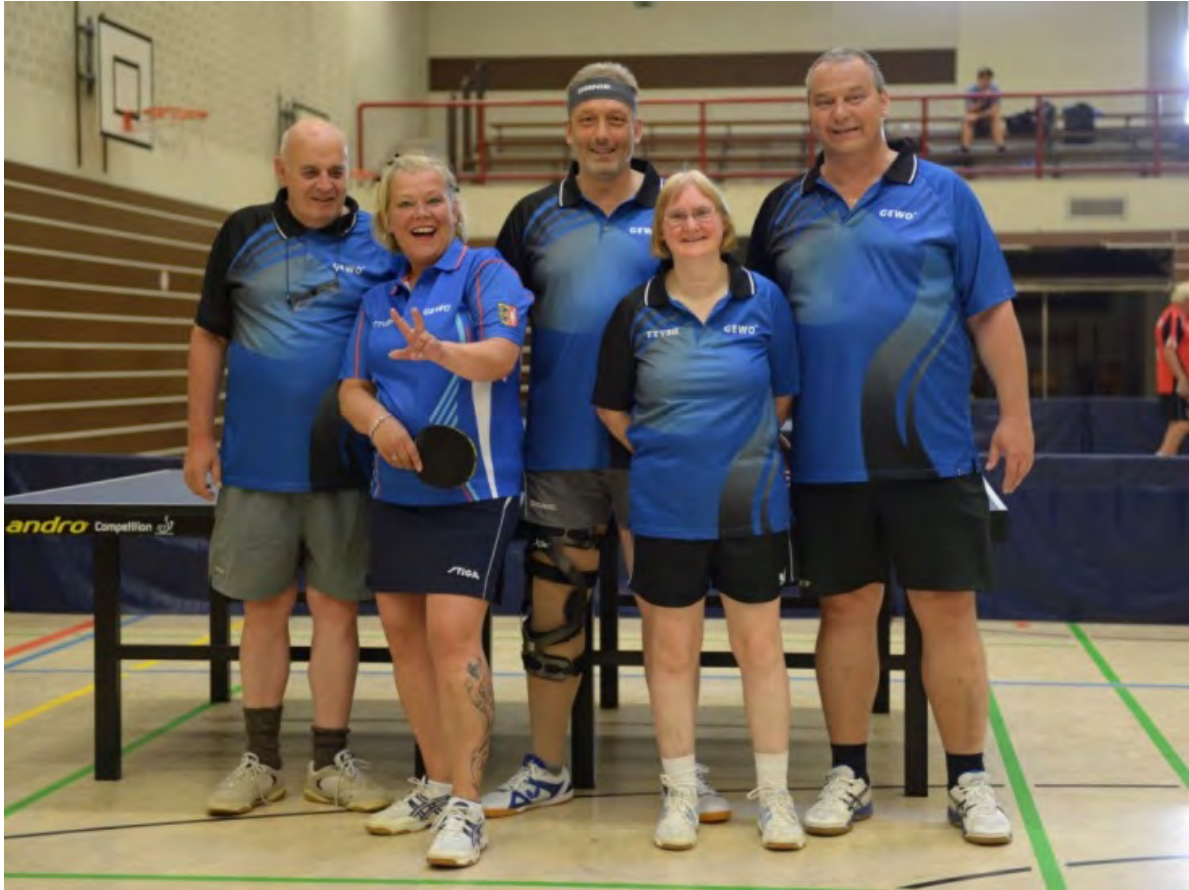
TTV Schleswig-Holstein 2