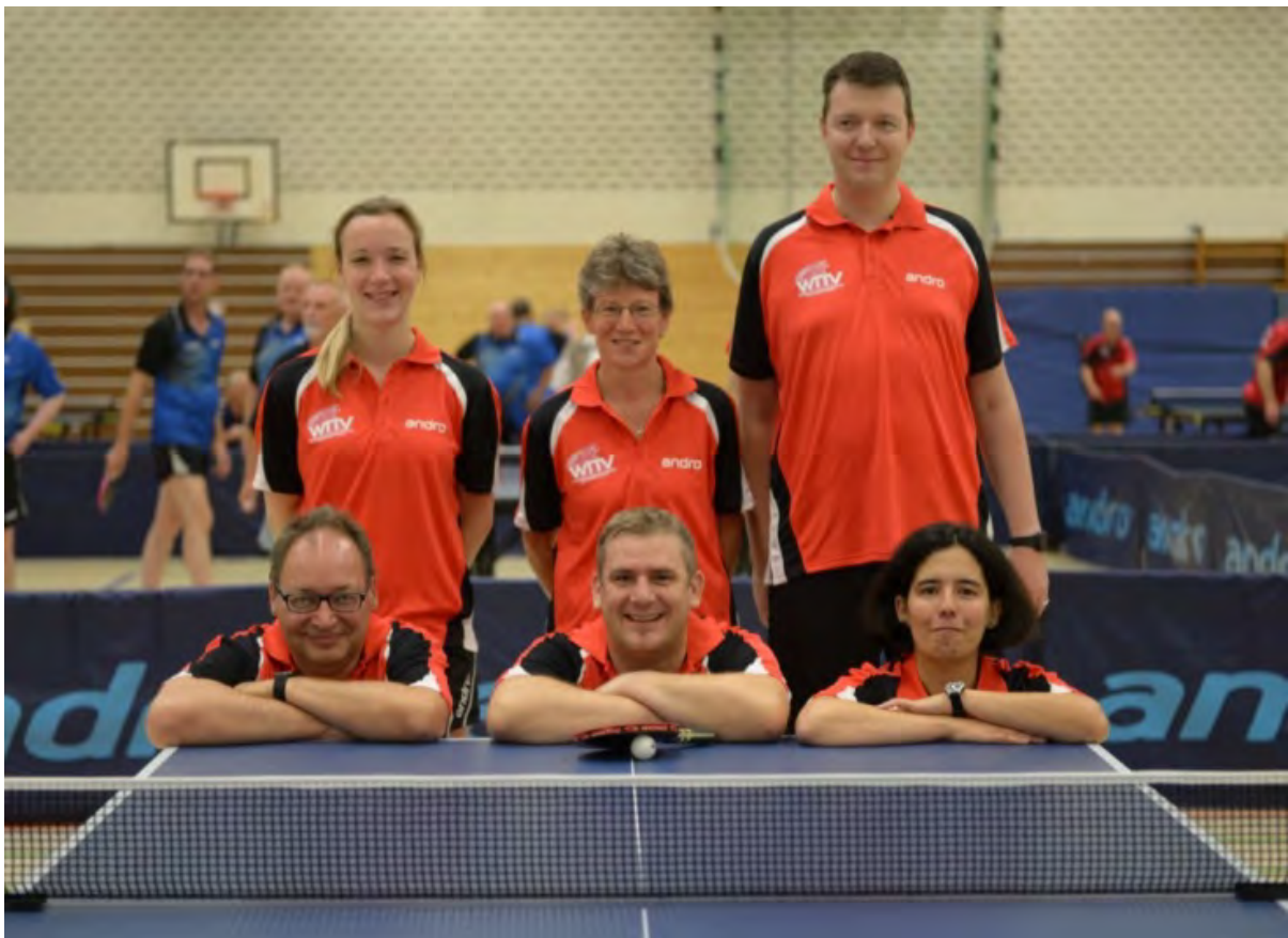
Westdeutscher TTV 3