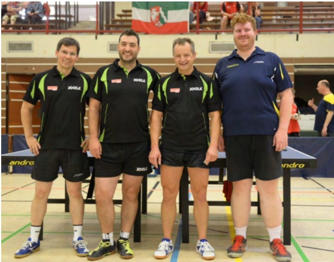
Berliner TTV 1