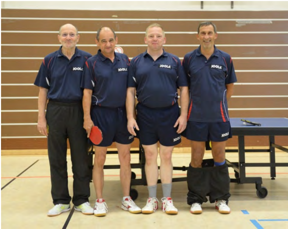
TTV Mecklenburg-Vorpommern 1