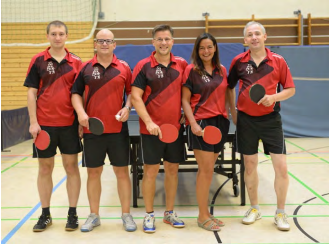
FTT Bremen 1