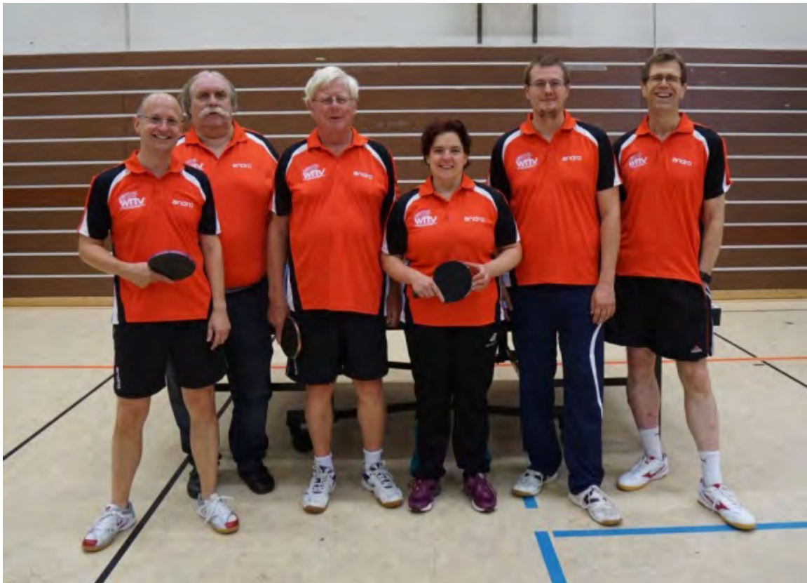
Westdeutscher TTV 2