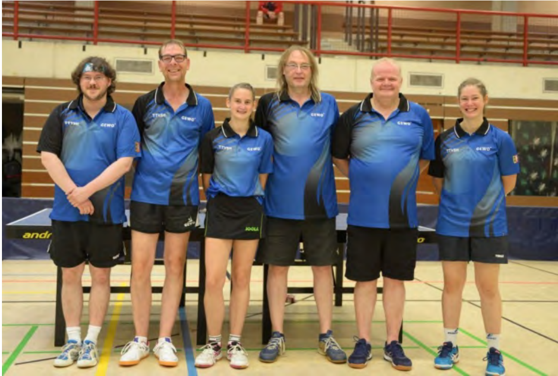
TTV Schleswig-Holstein 1