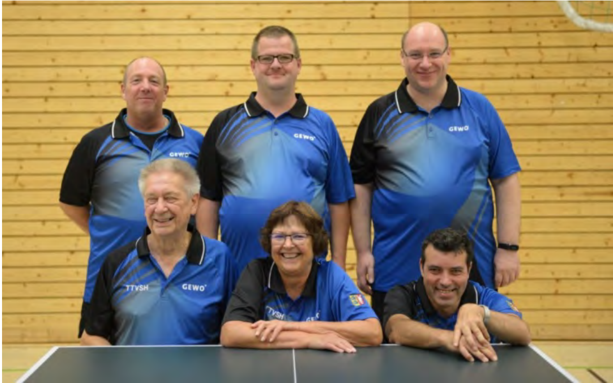
TTV Schleswig-Holstein 3