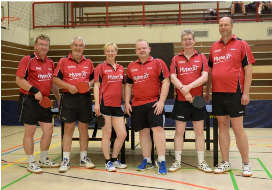
Hamburger TTV 2