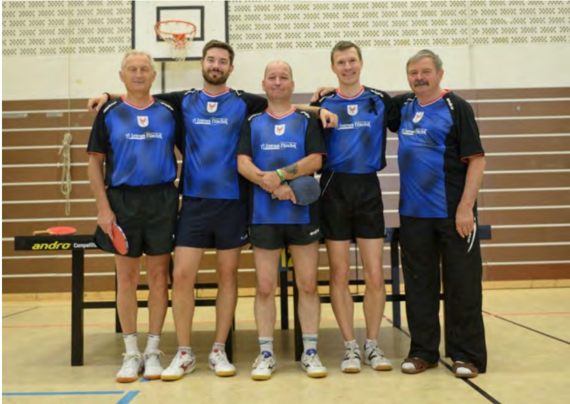
TTV Brandenburg 2