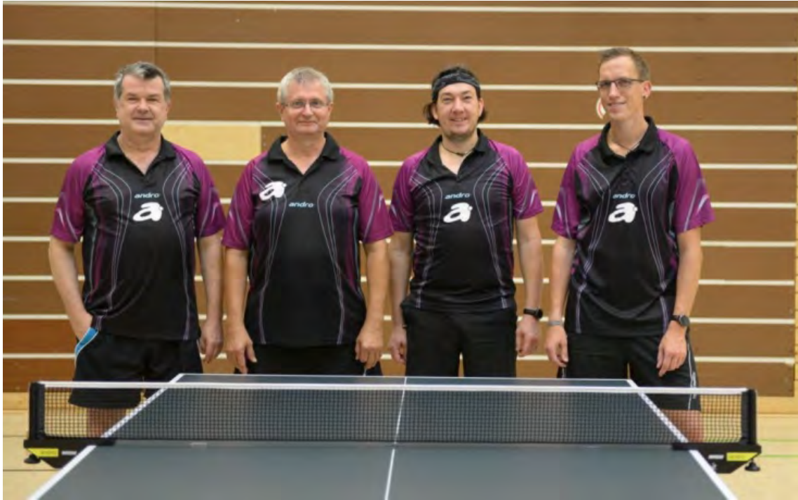
TTV Brandenburg 1