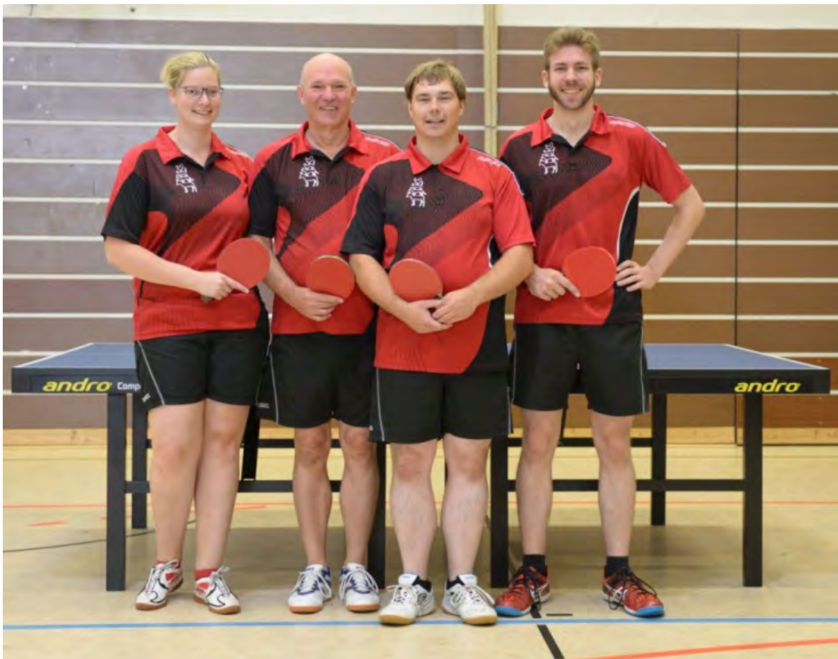
FTT Bremen 2