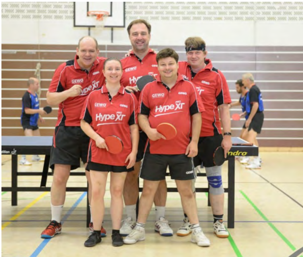
Hamburger TTV 1