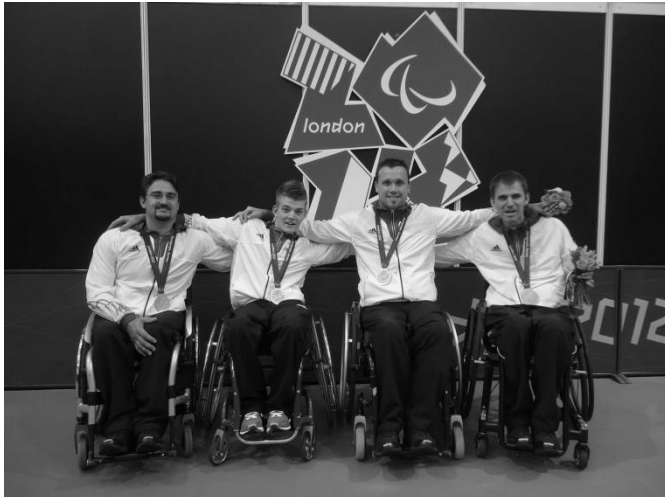
Das deutsche „Silber-Team“ von London 2012