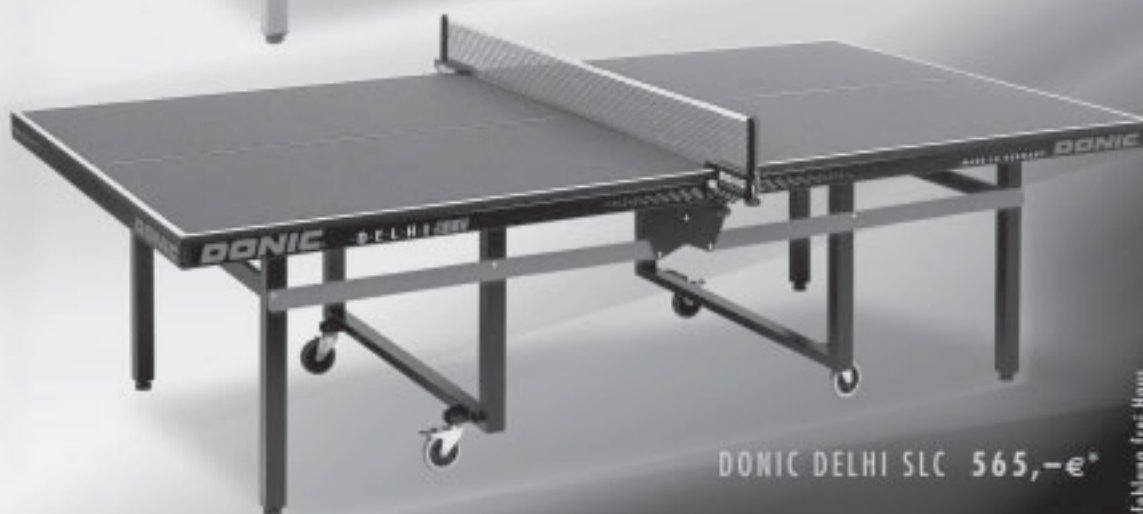
DONIC DELHI SLC 565,-€*

DIE DONIC SC-TECHNOLOGIE - WELTWEIT SPITZE!