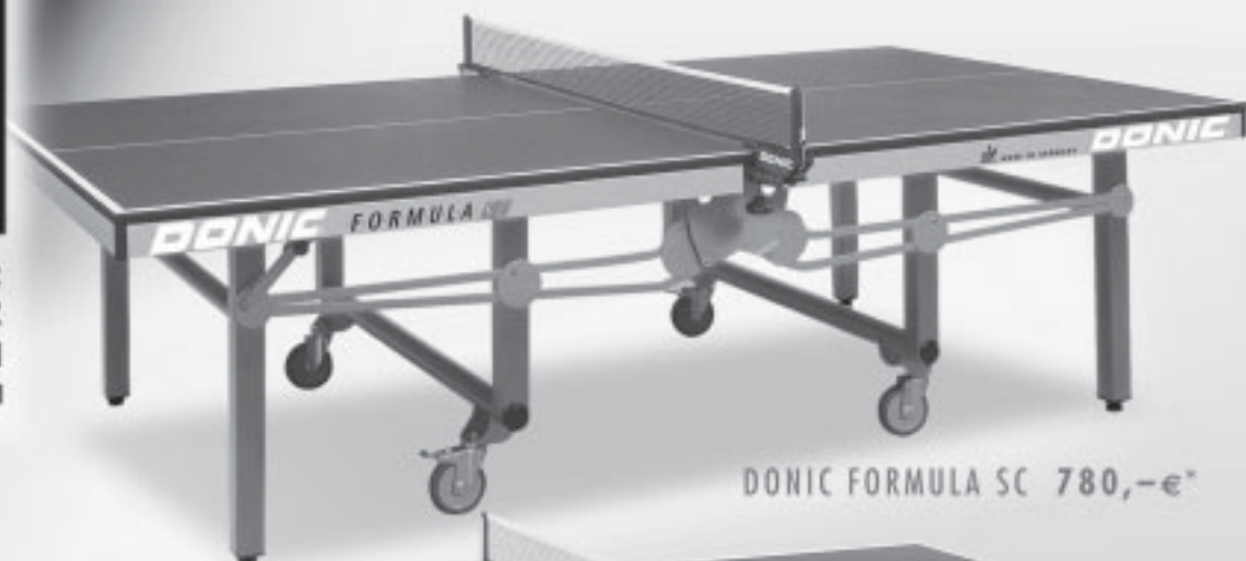
DONIC FORMULA SC 780,-€*