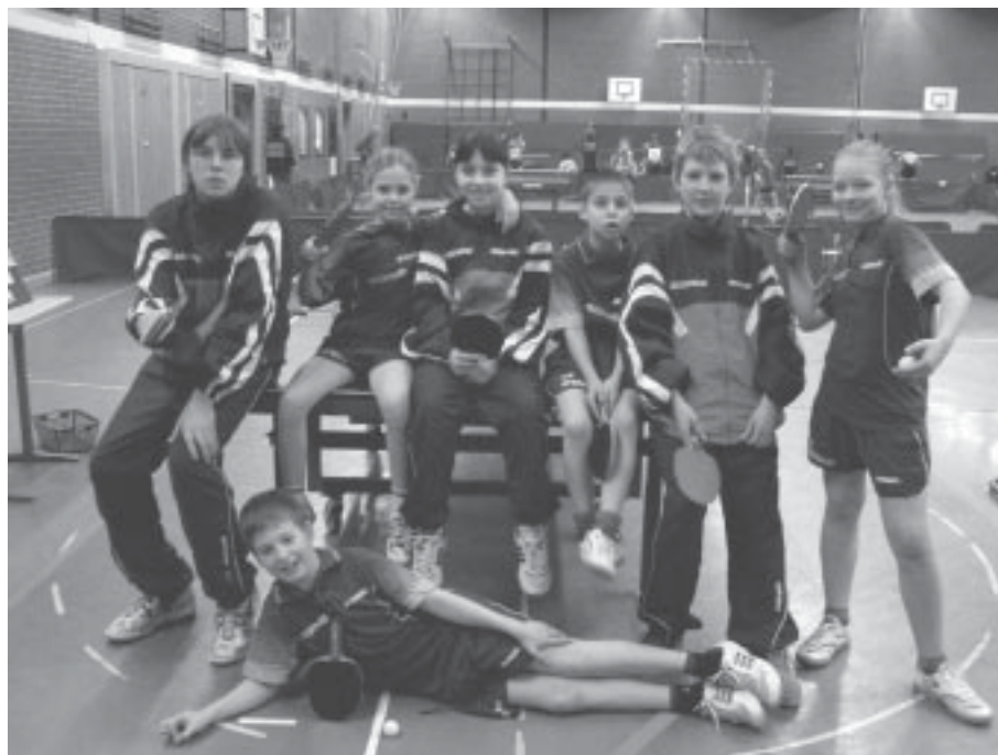
Foto oben: Das „Donic-Team-Berlin“ war zumindest vor den Wettkämpfen in bester Stimmung.

Im Gesamtergebnis nur ein fünfter Platz. Es ist meines Erachtens sehr wichtig, frühzeitig den